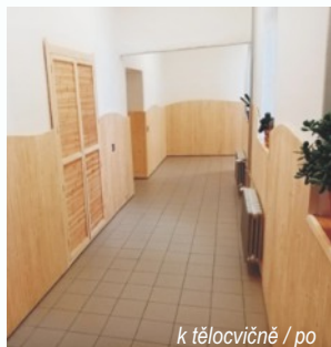
k tělocvičně / po