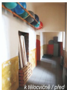
k tělocvičně / před