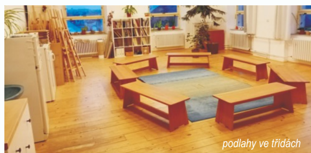
podlahy ve třídách