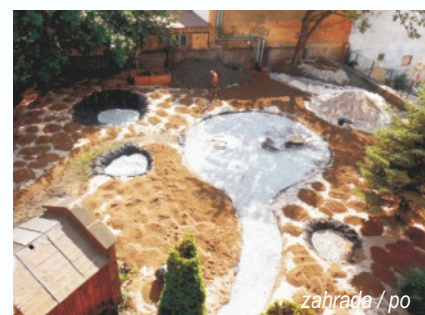
zahrada / po