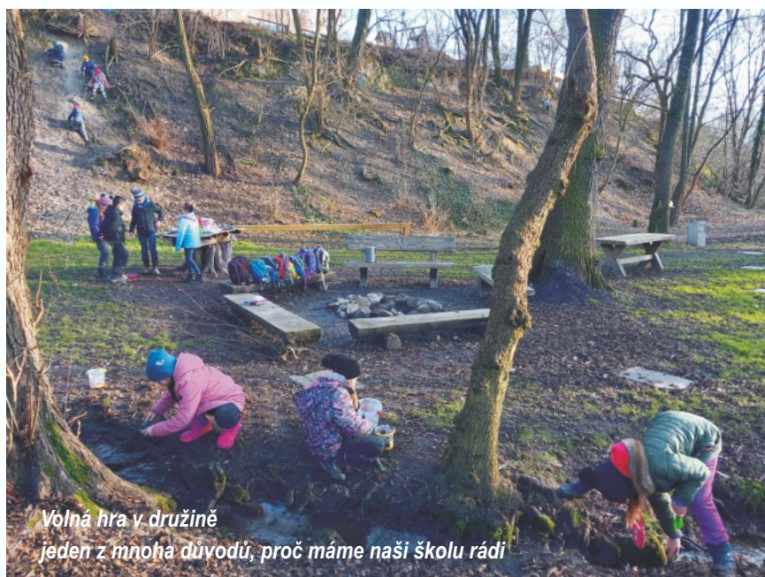
Volná hra v družině jeden z mnoha důvodů, proč máme naši školu rádi