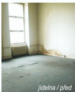
jídlna / před