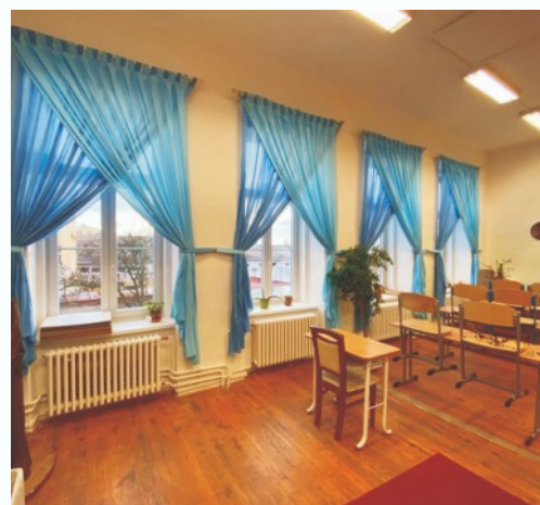
Třídní projekt - zútulnění učebny - 6.třída