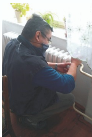
Rodičovská sbírka na termohlavice - úspora energií