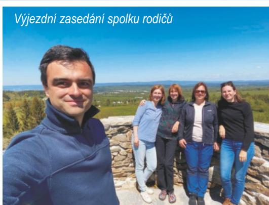
Výjezdní zasedání spolku rodičů