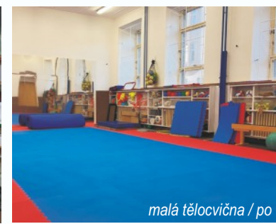
malá tělocvična / po