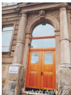
vstupní dveře / po