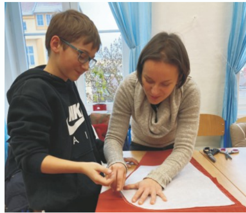
Spolupráce rodičů a dětí - 6.třída šití šatů na rytířskou slavnost