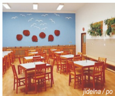
jídlna / po