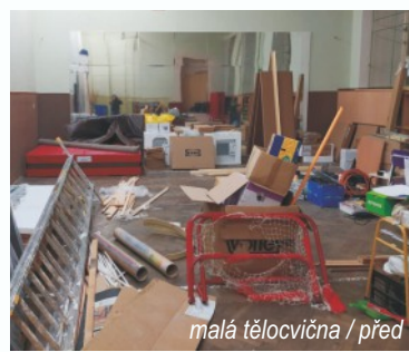
malá tělocvična / před