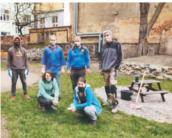
Rodičovská brigáda - rekonstrukce podlahy, rozšíření jídelny