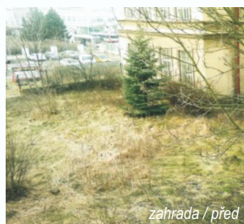
zahrada / před