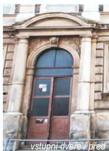
vstupní dveře / před