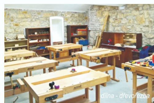
dílna - dřevorezba