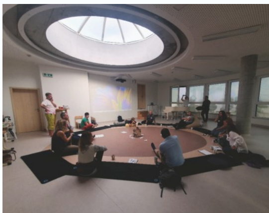
Sdílení zkušeností Setkání waldorfských spolků z celé ČR v Olomouci