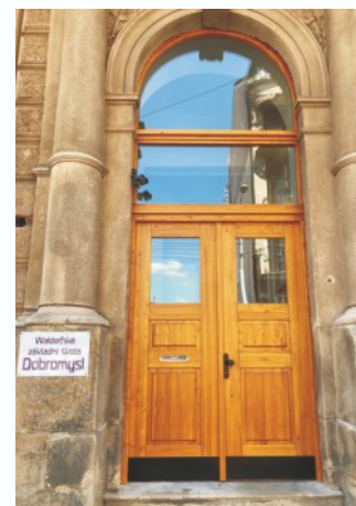
Výměna vchodových dveří