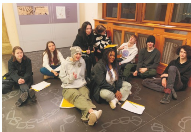
Historická chvíle - založení prvního alternativního lycea v Plzeňském kraji - otevření v září 2022