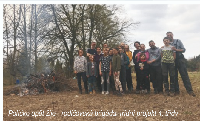
Políčko opět žije - rodičovská brigáda, třídní projekt 4. třídy